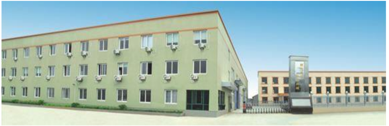
宁波顺兴开浩精工机械有限公司厂区

公司长期坚持“诚信为本、品质为先，自主创新、科学发展”的经营理念，公司自创办以来十分重视创新发展和质量管理，凭借雄厚的技术力量、齐全的机加工设备和管理团队，使整个生产过程严格控制于 ISO9001 质量管理体系，保证了产品质量和工艺的先进性。公司先后拥有多项自主知识产权，经多年努力，公司已形成完善的营销网络，销售网络遍布全国，并远销海外市场。旗下产品与售后服务得到了海内外业内人士的高度认可。企业长期坚持“信誉第一、质量第一”的经营方针，卓越的品质、优异的服务，诚信与发展始终一脉相承。